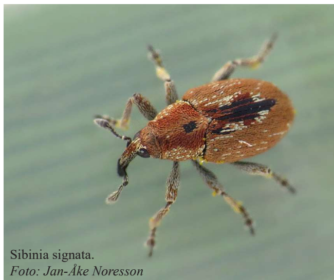
Sibinia signata .

Rödlistad NT. På baldersbrå. Arten är endast 2 mm lång exklusivt snyte och därmed lätt att missa. Sågs även av Jan-Åke Noresson på lokalen dagen efter.