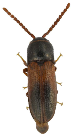
Xylophilus corticalis

Rödlistad NT. Togs i fönsterfälla i samband med en skalbaggsinventering under sommaren.