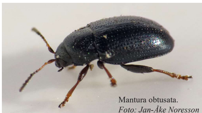
Mantura obtusata .

Ny för Västergötland. I grästuva. Medobservatör: Mats Ågren.