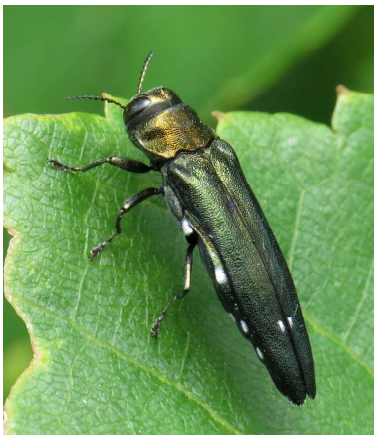
Agrilus biguttatus.