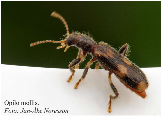
Opilo mollis.