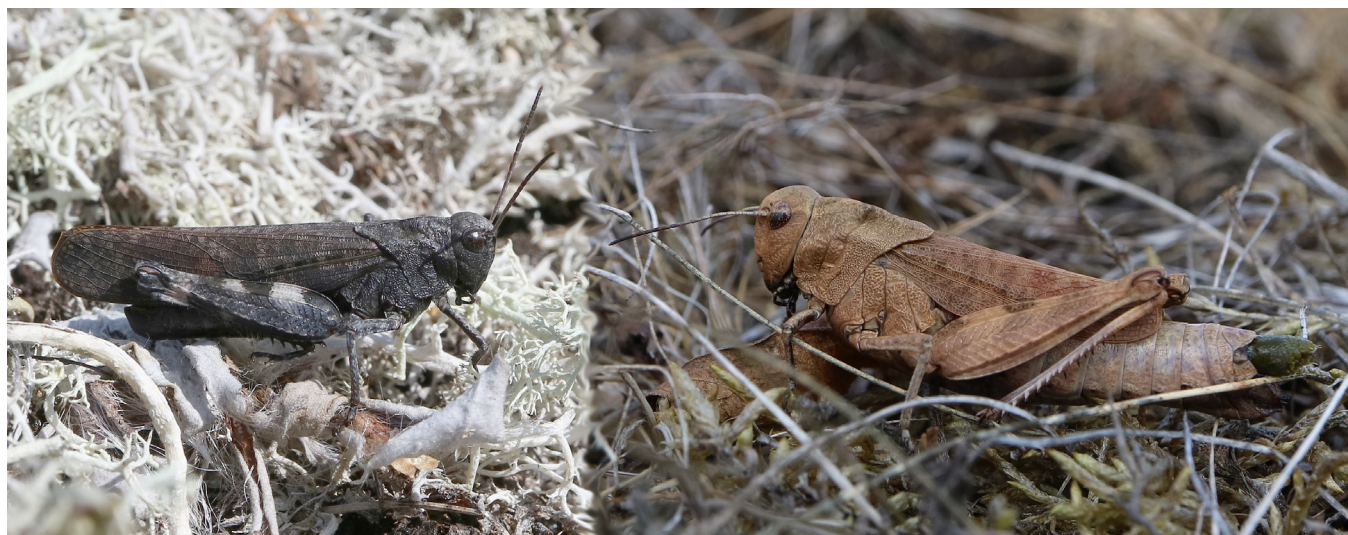
Trumgräshoppornas möte. Till vänster hanen, till höger honan.

Nästa svenska entomologmöte, det trettionde, kommer Sydostentomologerna att hålla i. Preliminärt blir vi inbjudna till Öland med inkvartering på folkhögskolan i Ölands Skogsby. Där var vi också på det tionde entomologmötet 1999. Efter 20 år åker vi till Öland igen!