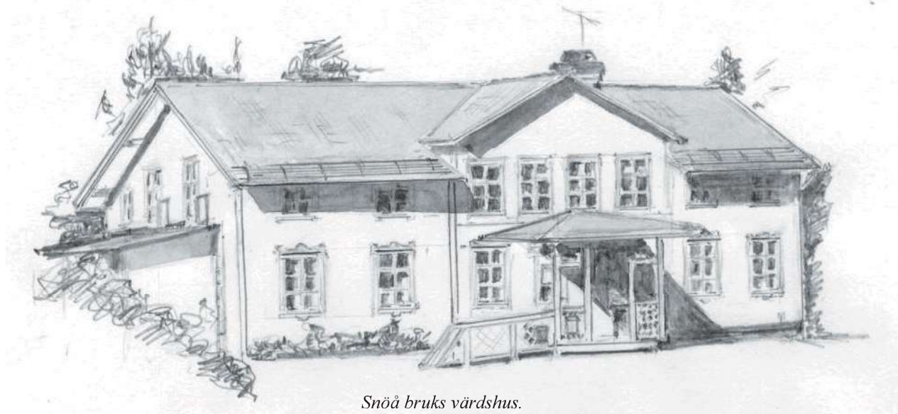
Snöå bruks vårdshus.

Lördagen ägnades helt åt exkursioner (exemplariskt förberedda genom ett på förhand utskickat kompendium med kartmaterial m.m.) och började under Bengt Ehnströms ledning vid Västerdalälvens strand vid Grådan med starrbevuxen fuktäng samt sandstrand och strandbrink. I området lever bl.a. Psammobius asper och Aegialia sabuleti . I sanden hade kortvingen Bledius subterraneus grävt sina gångar och jagades av jordlöparna Dyschirius politus och D. septentrionum . I vattnet påträffades av vattenskalbaggar endast Hydroporus palustris , men i lite hastigare strömmande vatten vid en forssträcka intill levde bäckbaggar Elmis