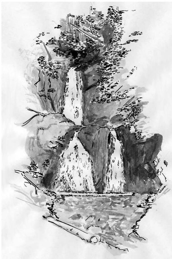
Forsakar, nedre fallet. Akvarell och tuschteckning av Bertil Andréén.

Deltagarna hade nu den stora lyckan att få se ett par av baggarna, som glittrade som